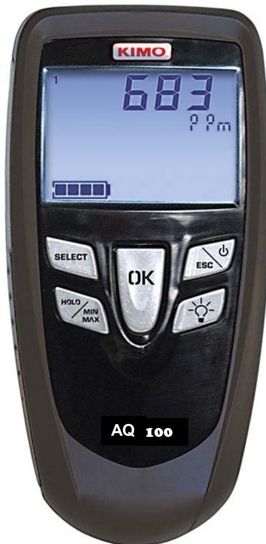
AQ100 - CO 2 / temperaturgivare kabelseparerad