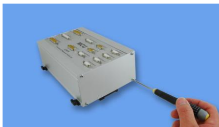
Skruva av sidoplåten