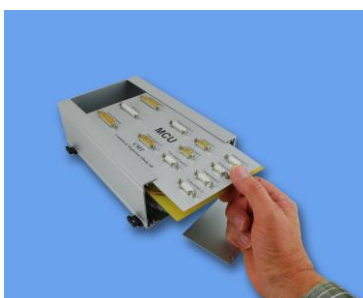
Dra ut toppstycket åt sidan